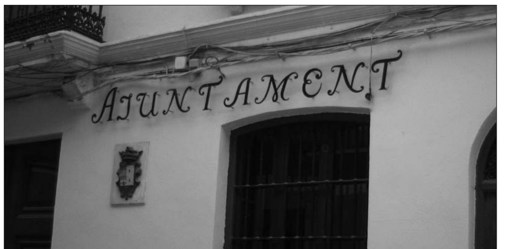
Fatxada de l'antic Ajuntament.