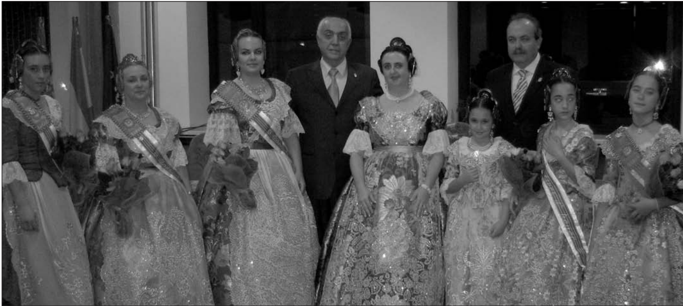
Acte de proclamació de les falleres de la J.L.F. al Saló d'Actes de l'Ajuntament.

estes xiquetes i senyorettes han fet gala en tots els actes públics celebrats fins al moment. La Proclamació, la Presentació... han sigut el calfament per a unes festes que enguany seran a Massanassa, més falleres que mai.