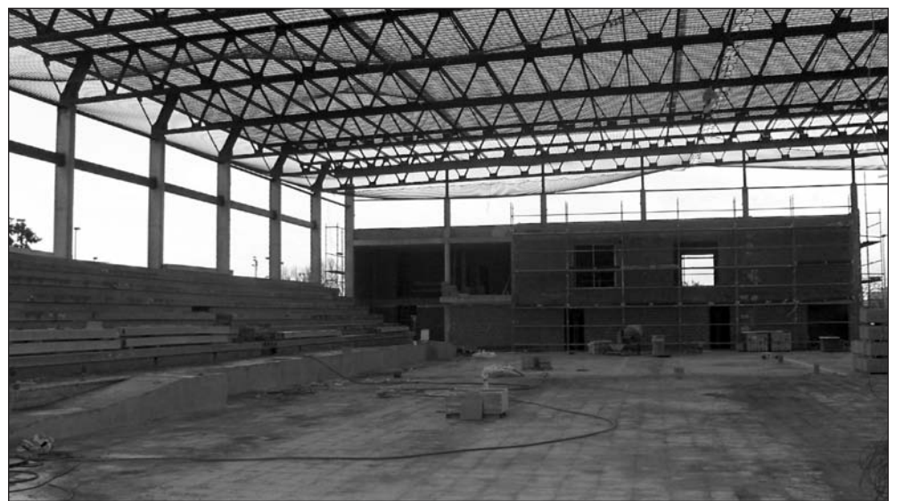
El Pavelló Cobert està molt adelantat.

També les partides de Cultura i Joventut i el capítol d'Educació te uns increments considerables, tot això sense oblidar les contínues inversions que es realitzen els últims anys, trobant-se actualment en execució el pavelló cobert, el camp de futbol de gespa artificial, el parc esportiu junt l'Alqueria de Sòria, entre altres actuacions.